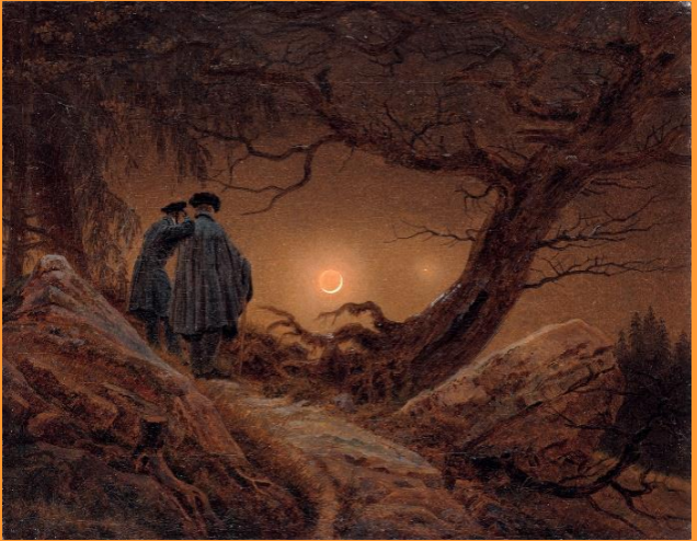
Caspar David Friedrich: Zwei Männer in Betrachtung des Mondes