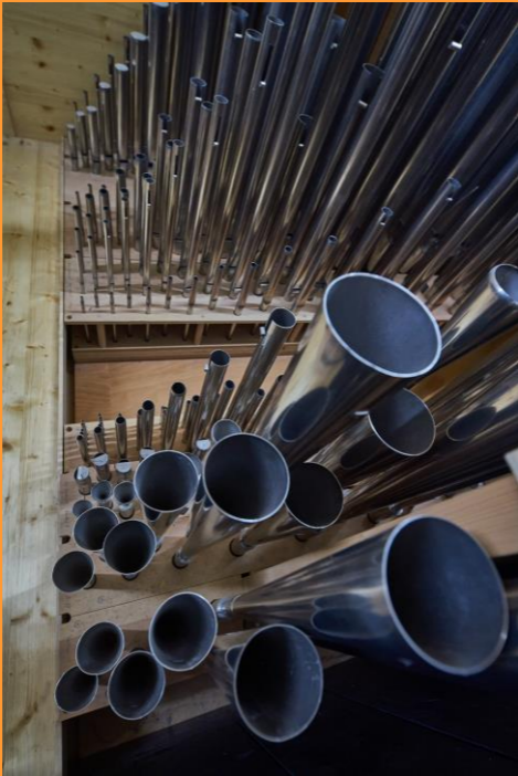
Inneres der Rieger-Orgel der Pauluskirche